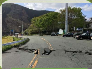
地表地震断層(当時)