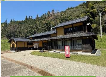
益城町四賢婦人記念館

熊本地震から10年。地震を起こした「布田川断層帯」は白川の成り立ちにも深くかかわっています。今回は益城町から南阿蘇村の震災遺構と阿蘇立野ダム、白川中流域のかんがい施設遺産を巡り、大地の変化と自然災害、人々の営みと災害への備えについて考えます。