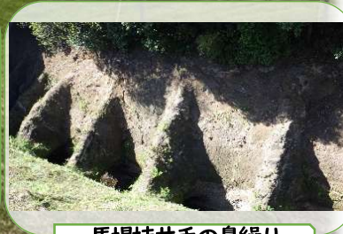
馬場桶井手の鼻線り

開催日：令和8年5月30日(土) 受付8:40～16:40頃解散予定 ※荒天の際は、5月31日(日)に延期