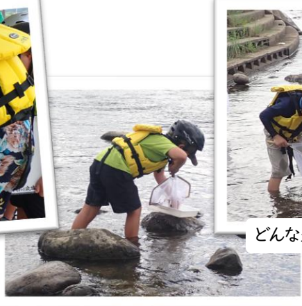
どんな生き物がいるかな？