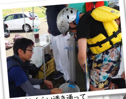
どのくらい透き通っているかな？