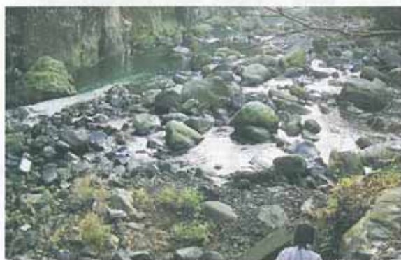
白川と黒川の合流地点から下流をみる。このあたり一帯に自然の石の美がみられる。

何回もの火山の噴火と河川の流れによって作り出された立野の地形。長い年月の間に僅かずつ変化しながら独特の地形を作り上げた。そのひとつがポットホール。甌穴（おうけつ）とも呼ばれるこの穴は、まさに自然が創りあげた芸術品。そして、人工物とも思える柱状節理の美しい岩肌が訪れた人の目を見張らせる。